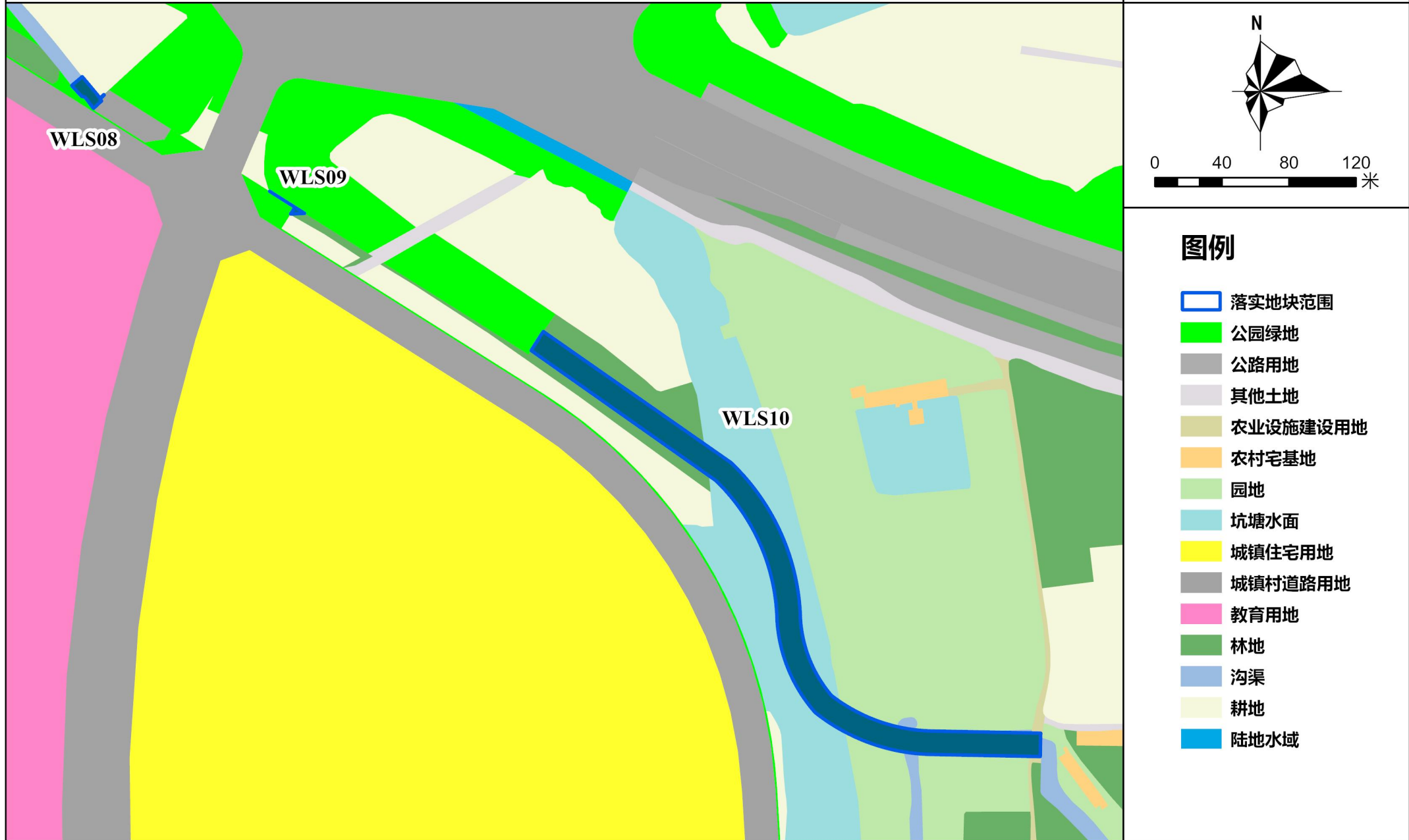
附图3-2:落实后地块 土地使用规划局部图