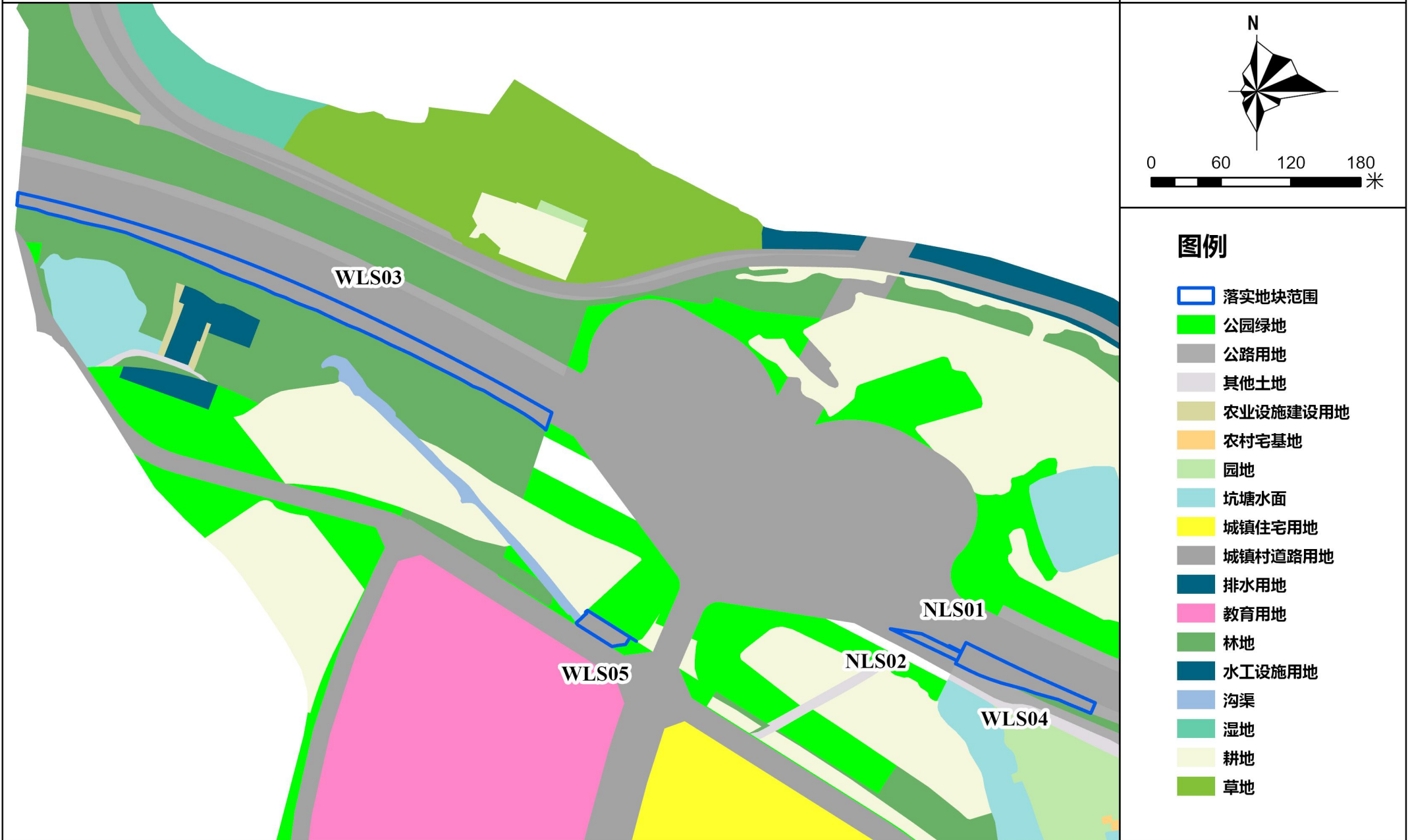
附图3-2:落实后地块土地使用规划局部图